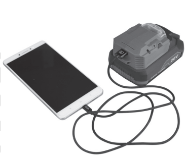
2. Σύνδεση της συσκευής (με την μπαταρία) με ένα κινητό