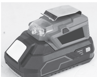
1. Προσαρμογή συσκευής σε μια μπαταρία