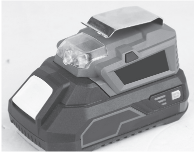
Attaching the product to a matching battery pack