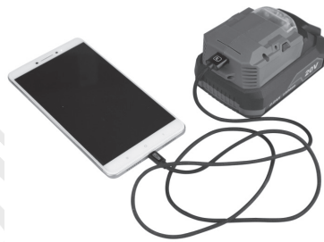
Connecting with a cell phone