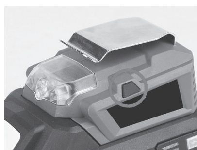
3. Πατήστε το κουμπί για έναρξη λειτουργίας