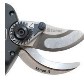
Nueva hoja con perfil descargado para mayor penetración