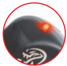
Protection inactive Protection not active Schutzfunktion nicht aktiv

Das Schnittschutzsystem ist nur im Modus "Handschuh aktiviert" aktiv.