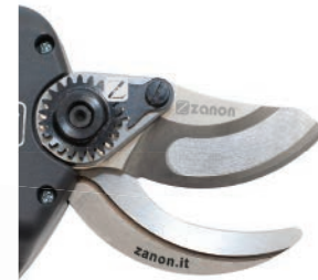
Neue Klinge mit unbelastetem Profil für einfacheres Schneiden