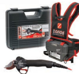
Kit DRIVE 350.S