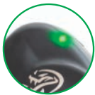
Protection active Active protection Schutzfunktion aktiv