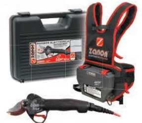
Kit DRIVE 350.S