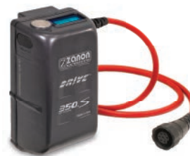
Batterie serie DRIVE.S con lettura digitale delle funzioni della forbice