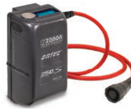
Batteries série DRIVE.S avec lecture numérique des fonctions de le sécateur